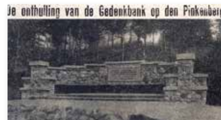
Foto op de voorpagina van de Velsche Courant

Woensdagmiddag 21 mei 1924 is de bank onthuld. Om half vier verenigden zich aan De Pinkenberg (bij de Rodelbaan) burgemeester, wethouders, gemeente-secretaris, vele raadsleden, enige leden van het vorig bestuur van de gemeente, het bestuur der geërfden en verschillende belangstellenden.