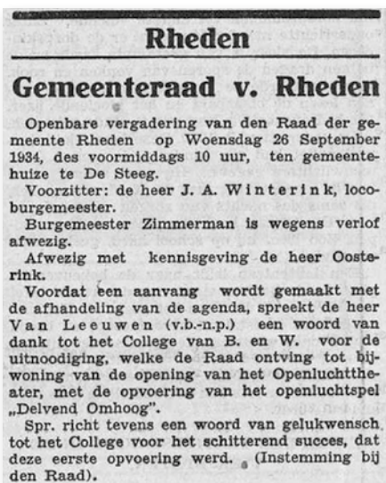
Stukje in de Arnhemse Courant van 26 september 1934