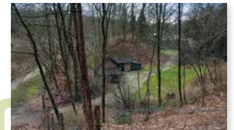
Artiestenonderkomen 4 maart 2024.

Ruim een jaar na de brand (zie 1996) heeft het theater weer een onderkomen voor artiesten. En dit keer is het met steen opgetrokken, in plaats van hout. Omdat het theater afgelegen ligt, heeft men voor steen gekozen. Door de verbouwing hebben de artiesten het seizoen 1996-1997 gebruikgemaakt van een noodvoorziening. Rhedense wethouder H. Alberse opende het gebouw woensdagmiddag 25 juni om 16.30 uur.