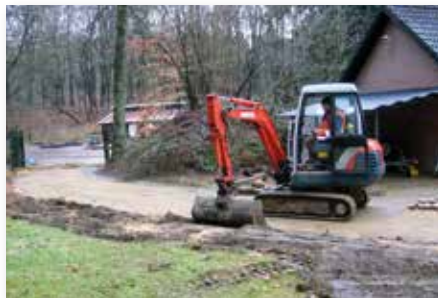
Aansluiting riolering kleedgebouw 2007.

Dit jaar is de voltooiing van de riolering voor de kleedruimte van de artiesten.