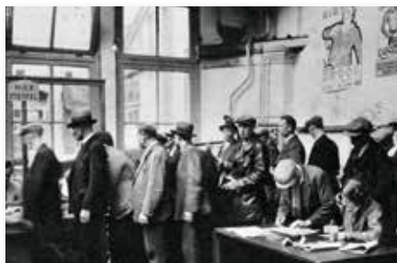
Stempelen in de crisisjaren

Nu denkt u waarschijnlijk: wat heeft dat allemaal met het openluchttheater te maken? Nou, na de schenking van de Geërfden van dit stuk gebied gingen de werklozen van de gemeente Rheden hier – met behoud van uitkering – aan het werk. De 'berg' werd verder uitgehold en het sportpark en het openluchttheater kwamen in een dal te liggen.