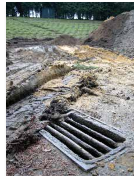
Drainage Speelveld terrein 2004.

De Alliantie diende in 2002 bij de gemeente Rheden een verzoek in voor subsidie voor een ingrijpende opknappbeurt van het toen bijna 70 jaar oude theater. Er waren problemen met de afwatering van het podium (gras) en de tribune was dringend toe aan een opknappbeurt. Daarnaast moest een deel van de omheining vervangen worden en was het bestraten van een aantal toegangspaden ook gewenst. De gemeente honoreerde dit verzoek door € 120.000,- voor de renovatie op te nemen in de meerjarenbegroting.