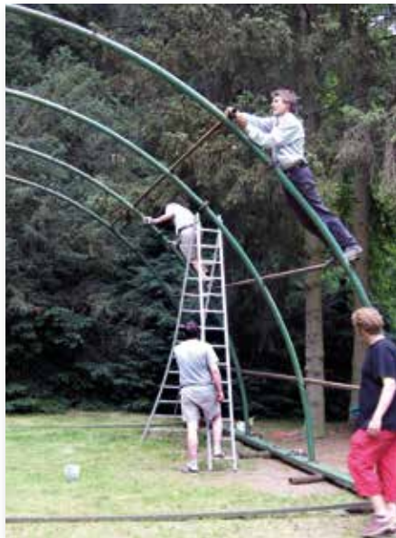
Opbouw van de overkapping. Op de grond onder de stelling zijn de boomstammen goed te zien.

Bij regen, of dreiging daarvan, werd de constructie met twee lieren, rollend op stukken boomstam, naar voren getrokken. In de richting van de tribune. De boomstammen moesten telkens van achter naar voren geplaatst worden om de zaak rollend te houden. Na afloop van de voorstelling ging het hele gevaarte dezelfde weg terug. Dat was écht hard werken, zo vertelden enkele vrijwilligers. In 2008 werd deze constructie vervangen door een luifel, op een vaste plek boven het podium.