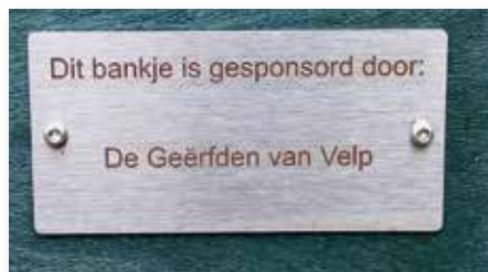
Geërfden crowdfunding bank.

Van alle personen en bedrijven is een bordje op de bank geplaatst, waardoor een zitplaats gegarandeerd is.