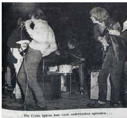
The Crabs winnaars augustus 1965

Eén troost: volgend jaar zal er weer, door wie dan ook, om de wisselbokaal gestreden worden. Alvast één raad: Neem een helm en desnoods je moeder mee”.