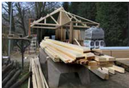
Bouw Geërfdenhut 2006.

In 2005 werd begonnen met de werkzaamheden die in 2006 werden afgerond met de opening van de horecakijskiosk op 24 juni. Het gebouwtje kreeg de naam 'de Geërfdenhut', vernoemd naar de Geërfden van het dorp Velp die € 10.000,- beschikbaar stelden voor de bouw.