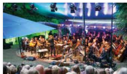
Gelders Orkest en Di-Rect.