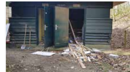
Renovatie toiletten 2019.

Na een jarenlange aanloop wordt vanaf 2019 het theater (in verschillende fasen) opnieuw gerenoveerd, omdat er onderhoud aan verschillende gebouwen en banken moet gebeuren. De gemeenten Rheden en Rozendaal zorgen voor financiering, zodat er in 2019 gestart kan worden met de renovatie. In de eerste fase wordt de gehele elektrische installatie van het theater vernieuwd. Ook het toiletgebouw wordt opgeknapt. Hierbij wordt de buitenkant van het gebouw in originele staat behouden.