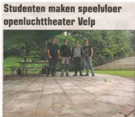
Regiobode 8 juni studenten bestraten.

Het Kleine TentenTheaterfestival was een samenwerking met de Toneelschool en werd in 2001 voor het eerst georganiseerd in het openluchttheater. Het Kleine TentenTheaterfestival bestond uit korte improvisatievoorstellingen van elk zo'n 20 minuten. Deze voorstellingen werden gebracht door de studenten van de theateropleiding. In 2015 was de laatste editie van dit festival.