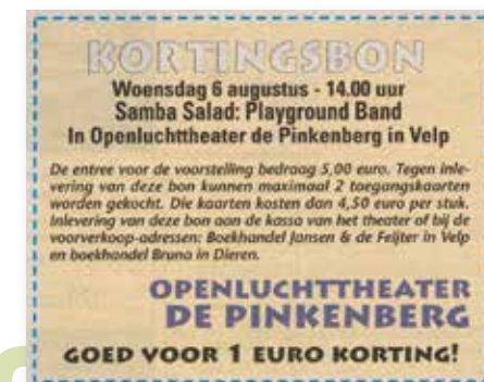
Regiobode 31 juli kortingsbon Samba Salad

Sinds jaar en dag worden op de woensdagen van de zomervakantie kindervoorstellingen georganiseerd. Om zo veel mogelijk kinderen in de gelegenheid te stellen hierbij aanwezig te zijn, werden in de Regiobode kortingsbonnen geplaatst. Ze werden veel gebruikt.