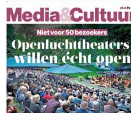
PZC dinsdag 1 juni 2021.

Begin 2020 kwam corona opzetten... en nee, het was geen nieuwe band of attractie voor het openluchttheater. Het was een regelrechte domper en een regelrechte catastrofe te noemen.