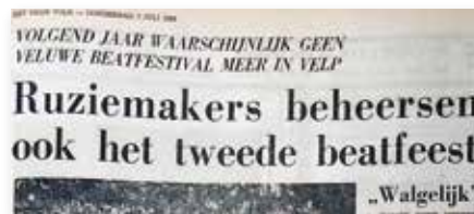
Vrije Volk 7 juli 1966

Het Veluwe Beat Festival krijgt na een rumoerig optreden in 1965 op woensdagavond 6 juli 1966 om 20.00 uur toch een vervolg in theater De Pinkenberg. De accommodatie telde zo’n 1.400 zitplaatsen.